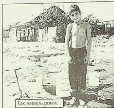
Так живуть роми.