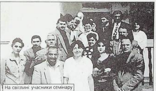
На світлині: учасники семінару

Ми розказали, як працюють на Закарпатті ромські дитячі заклади.