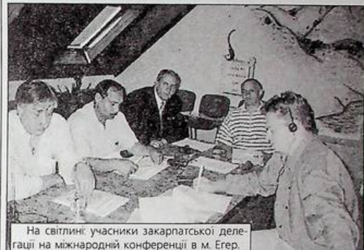
На світлині: учасники закарпатської делегації на міжнародній конференції в м. Егер.