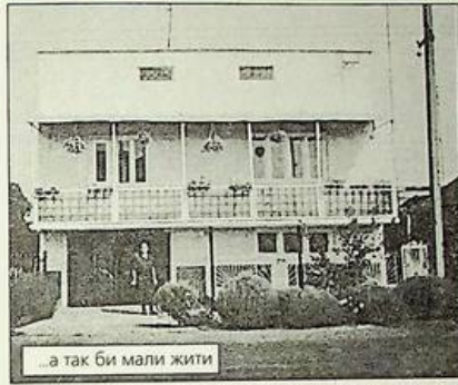
...а так би мали жити