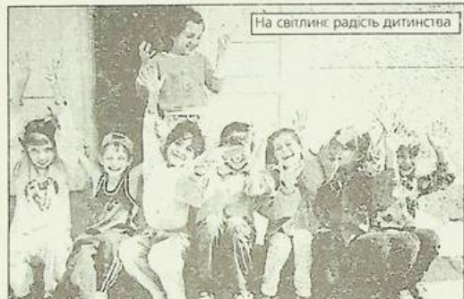
На світлин: радість дитинства

ди. Зовсім не підготовлені до школи. Жоден не відвідував дитячий садочок, не пройшов дошкільну підготовку. Це "дикі" діти. Тому майже два перші місяці навчала, як треба заходити, влізати, сидіти в класі, лігати, лігати дозволу зайти або вийти під час уроку. Зошит і ручку - діти вперше побачили в школі.