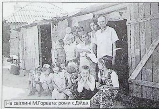
роми с.Діда.

Закарпатці добре знають генерала міліції Геннадія Геннадійовича Москаля. Цими днями він знову повернувся на дороге йому Закарпаття. Вітаючи нового голову обласної державної адміністрації, бажаємо з новою дружньою командою успішно працювати для блага людей, розквіту краю.