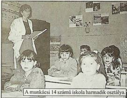
A munkácsi 14 számú iskola harmadik osztálya.