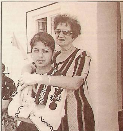
Поряд із "дорослими" ромськими фестивалями на Мукачівщині започатковано районний дитячий фестиваль.

Все у ромській родині "крутиться" довкола матері. Вона має найсильніший вплив на формування душі й характеру дитини. Чимало сімей створюються рано. Так визначила цьому народу сама природа. Перше народження дитини буває у 13-14 років. Молода майбутня мама, відчуваючи поруч із собою досвідчену матір, інших членів родини, ще тоді, коли в її