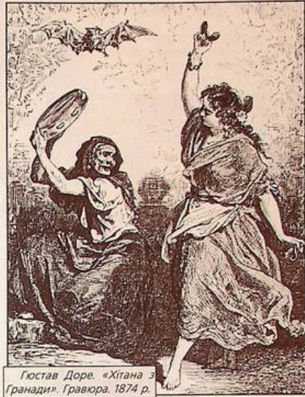
Гюстава Доре. «Хітана з Гранадії». Гравюра. 1874 р.

Гюстава Доре ми знаємо, насамперед, за ілюстраціями до "Дон Кихота". Здається, тепер не можна собі уявити інакше "лицаря сумного образу" і його товстого зброносця. Доре був плідний. Він оформив Біблію, ілюстрував Данте і Рабле, а також казки Шарля Перро. Усе, що виходило з-під пера чи різця французького художника, стало класикою. Однею з граней його творчості був побутовий жанр. Доре малював навколишній світ, точно підмчаючи все характерне. Знаменита його серія, присвячена Лондону. Тут є усі маніри казая життя в циліндрах, портові вантажники, убогість нетр. Та нам, звичайно ж, цікавіші ілюстрації до «Подорожі по Іспанії». Ця розкішно видана книга дає об'ємний образ спекотної країни. Сотні замальовок відображають іспанську екзотику і повсякденність. Деякі з них і донині використовуються для оформлення новели «Кармен». Доре не забув зобразити ні робітницю тютюнової фабрики, ні контрабандистів, які несуть важкі тюки вузькими шляхами.