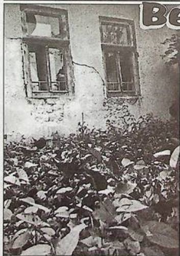
(Закінчення. Початок на 3 стор.)

Леонід Савицький, власкор "Романі Яз", Кіровоградська область