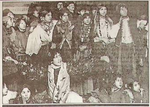
Роми-кельдари в службі. 30-ті роки.