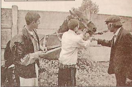
Лист у редакцію