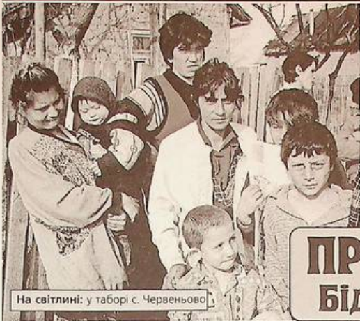
На світліні: у таборі с. Червеньово