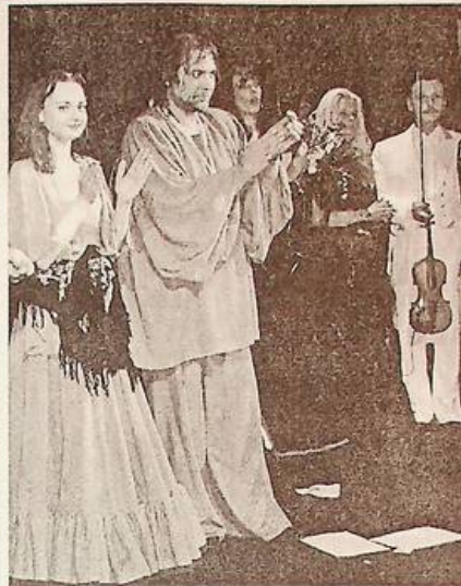
Голова 3-го Міжнародного фестивалю ромського театру