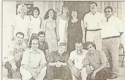
"Романі Яг" збрала своїх власних кореспондентів, які працюватимуть у різних регіонах нашої держави

Серед проблем, які поставили перед редакційним колективом, - перекладка. Про її початок оголошено у попередньому номері газети. Поспішайте перекладати.