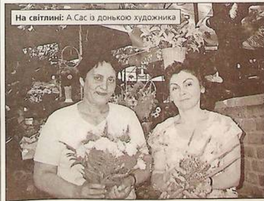
На світліні: А Сас із донькою художника