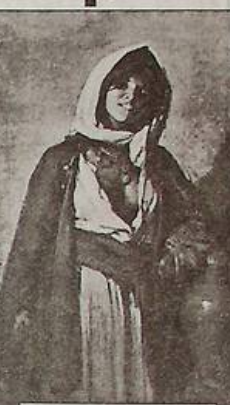
Ніколає Григореску. «Циганка з Гергань». Х., м. 1872.

Одного разу хазіяни магазину Гебауер спантелили Ніколає новиною. Солідний пан згоден купити