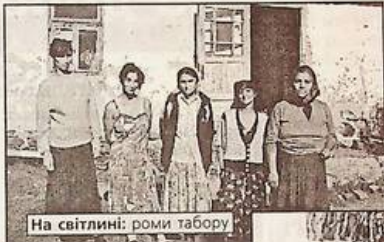
На світлині: роми табору

Є закони, але вони ніби не для ромів писані, коли йдеться про соціальне забезпечення.