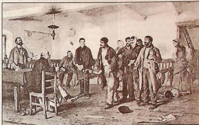
Шандор Біхари "Перед суддею". Полотно, олія, друга половина XIX століття.

кілька днів поїхав до Парижа. Тут він 1,5 роки навчався в одного з найкращих вчителів Лауренса. Через 5 місяців намалював картину "Примірка циліндру", де було зображено хлопця з села, який серед натовпу приміряє циліндр. На цій картині можна помітити здоровий гумор. Його здібності швидко розвинулись у Парижі.