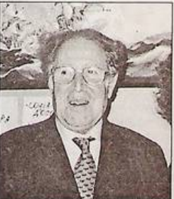
Генрі Чіклуна, координатор діяльності Ради Європи у справах ромів (циган) і кочівників:

- Пропоную створити свої групи у кожному регіоні. Це дасть можливість оновити пропонувану державними структурами програму щодо ромів. А взагалі, я впевнена, що круглий стіл, учасниками якого ми є, внесе свій внесок в розробку політики держави.