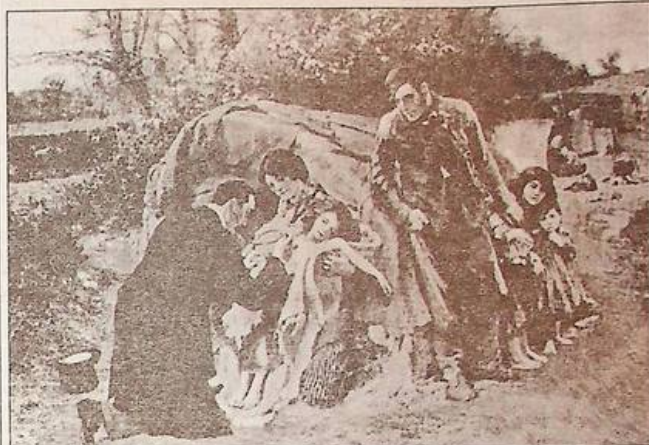
Вільям Смолл. "Добрий самаритянин", 1869 р., П. м.

англійських ромів, зробленого у формі склепіння (пізніше такі будуть неодноразово сфотографованими). І все-таки головне тут - гуманістичне моральне послання. Освічений чужинець-"гадже" знаходить там, де велить йому бути лікарська етика. Навряд чи бідно одягнений глава сімейства зможе хоч щось заплатити лікарю. Але лікар і не чекає за свій християнський вчинок нагороди.