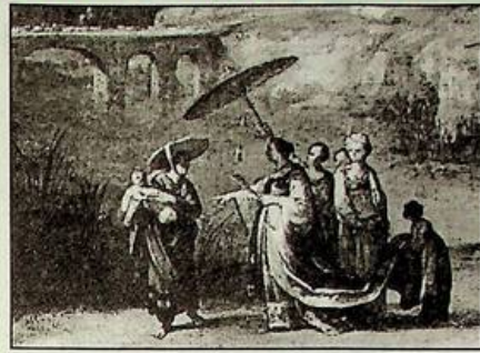
Бартоломео Бренберг (1600-1657) "Знайдений Мойсей". П., о.

В Угорщині ромів називали "фараонове плем'я". В Англії - "джіпси" (перекручене - "єгиптяни"). Викликано це тим, що перші табори, які перекочували в Європу, представлялися вихідцями з Єгипту. Майже кожен автор, який описує ромську історію, згадує про багатовікову помилку європейців і складає подяку вченим, котрі розкрили справжнє походження кочового народу. Я впевнений, читачам ці факти добре знайомі, згадуємо про них лише для того, щоб показати - не кожна помилка на шкоду. Завдяки легенді про єгипетські корені ромів, дослідники мають додатковий образотворчий матеріал. Стародавній європейський живопис за своєю технічною витонченістю був наївним. Художники, які зображували біблійні сюжети, без тієї сумнівної наряджати героїв картин у костюми своїх сучасників. Внаслідок цього Понтій Пилат нерідко опинявся в одязі німецького судді, а римські легіонери, які бичують Хри-