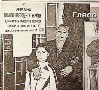
УКРАЇНА ВИБОРИ ПРЕЗИДЕНТА УКРАЇНИ ДІЛЬНИЦЯ ВИБОРЧА НОРМІСЬКА ВИБОРЧА ДІЛЬНИЦЯ № 7 ТЕРИТОРІАЛЬНО ВИБОРЧИЙ ОКРУГ № 120