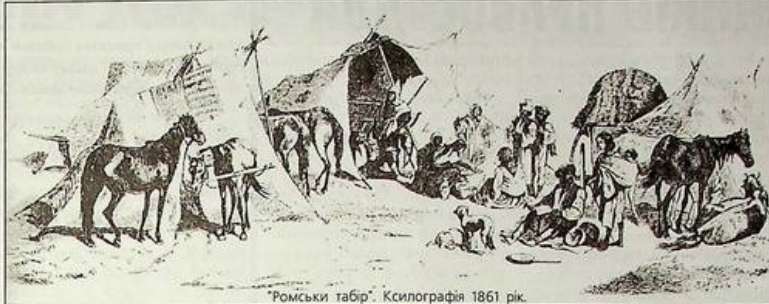
"Ромський табір". Ксилографія 1861 рік.

століття зробив відкриття про походження циган. І подальші дослідження його послідовників підтверджували і уточнювали його висновки, розширювали і поглиблювали знання про цей народ.