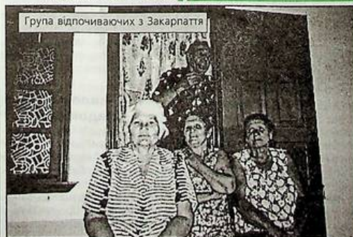
Група відпочиваючих з Закарпаття