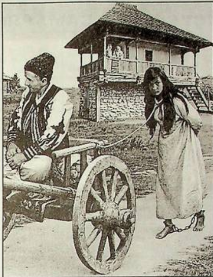
Микола Бессонов. "Дорога на базар". Комп'ютерний живопис. 2003 р.

Продовжимо нашу розповідь про рабство ромів у Дунайських князівствах. Цього разу вона буде не про стародавнє мистецтво. Я розповім про те, на чому заснована моя власна історична картина.