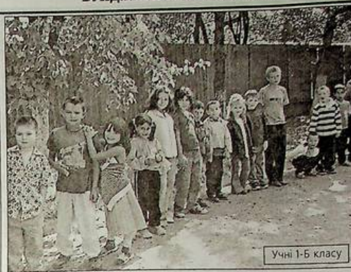
Учні 1-5 класу