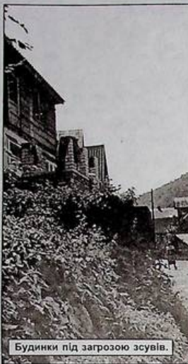
Будинки під загрозою зсувів.

Генеральному прокурору України Геннадію Васильєву, Депутату Верховної Ради України Оресту Климушу від голови жіночої ромської організації "Щасливий світ" ("Бахталі лума") Рахівського району Закарпатської області