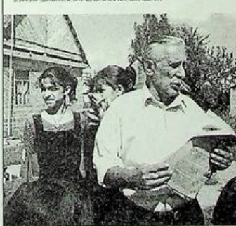
Язык вражды 2006

ЦИГАНСЬКЕ ТЕРМІНОЛОГІЧНЕ СЛОВАРНО ПОСИЛАННЯ ЦЫГАН