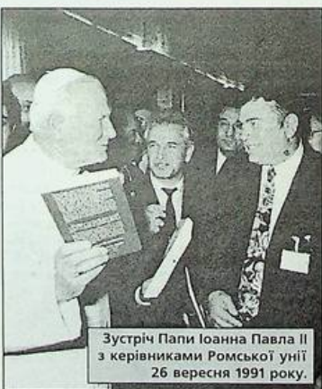
Зустріч Папи Іоанна Павла II з керівниками Ромської унії 26 вересня 1991 року.

Це була не єдина зустріч Папи VI з ромами. Він зустрічався з ними ще будучи архієпископом Мілана, а також під час ювілейного 1975 року, присвяченого "Примиренню з Богом і з братами". Тоді він говорив їм про