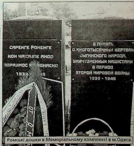
Ромські дошки в Меморіальному комплексі в м.Одеса.