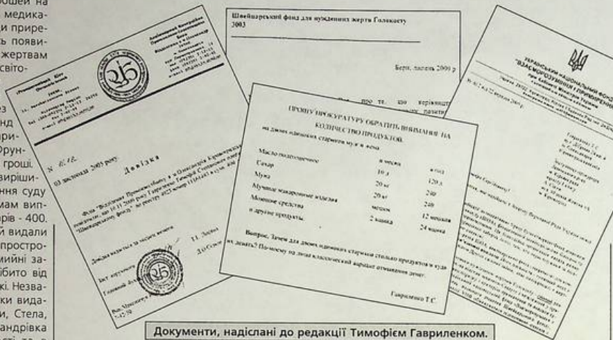
Документи, надіслані до редакції Тимофієм Гавриленком.

У редакцію надійшов черговий лист-скарга з приводу виплат ромам, жертвам Голокосту часів Другої світової війни. Цього разу - від ромів Кіровоградщини.