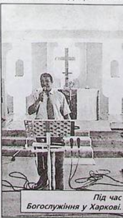
Під час Богослужіння у Харкові.