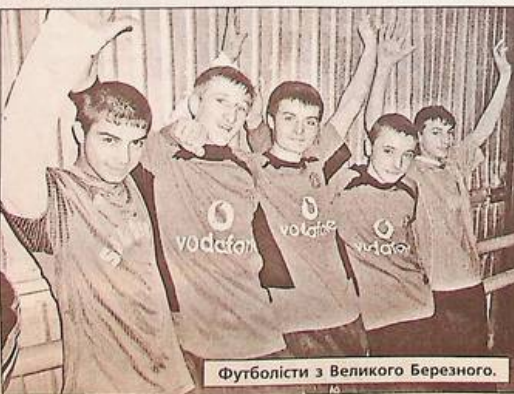
Футболісти з Великого Березного.