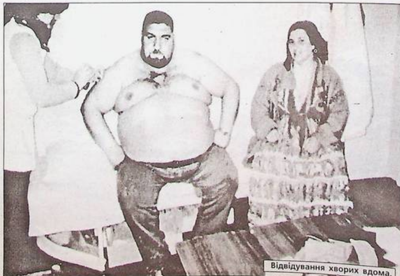
Відвідування хворих вдома.