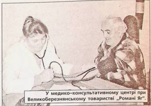
У медико-консультативному центрі при Великоберезнянському товаристві „Романі Яг”.

При Великоберезнянському культурно-просвітньому товаристві „Романі Яг” був створений медико-консультативний центр у вересні 2008 року. Поштовхом до цього стало те, що за останні роки в районі зросла захворюваність на туберкульоз, зросла кількість хвороб шлунково-кишкового тракту, печінки. Спостерігалось зростання дитячої захворюваності.