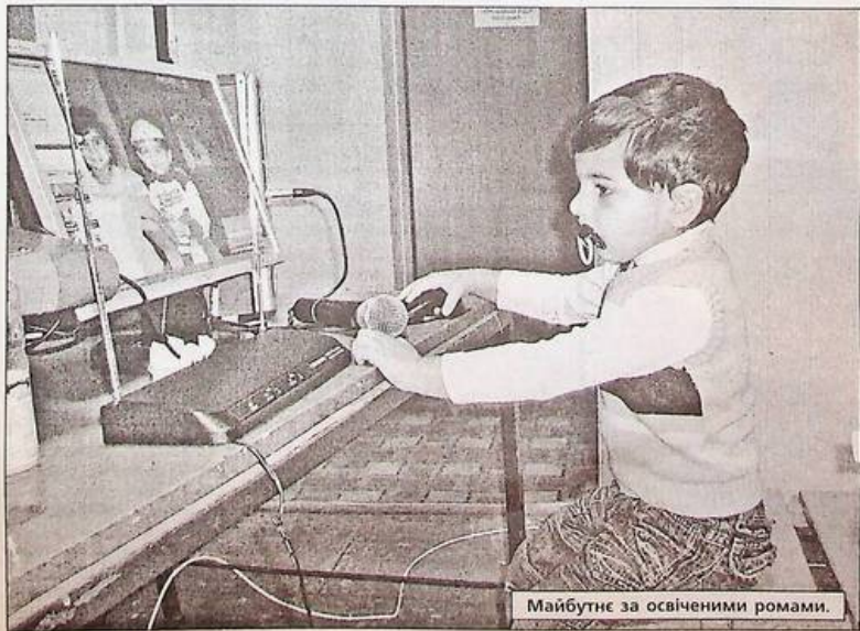
Майбутнє за освіченими ромами.