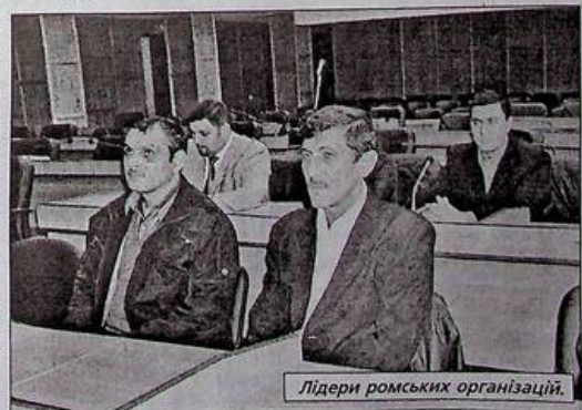
Лідери ромських організацій.