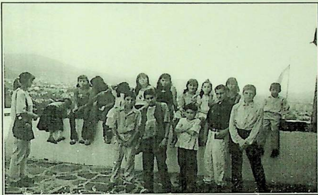
Під час екскурсії до Мукачівського замку. 2002 рік.