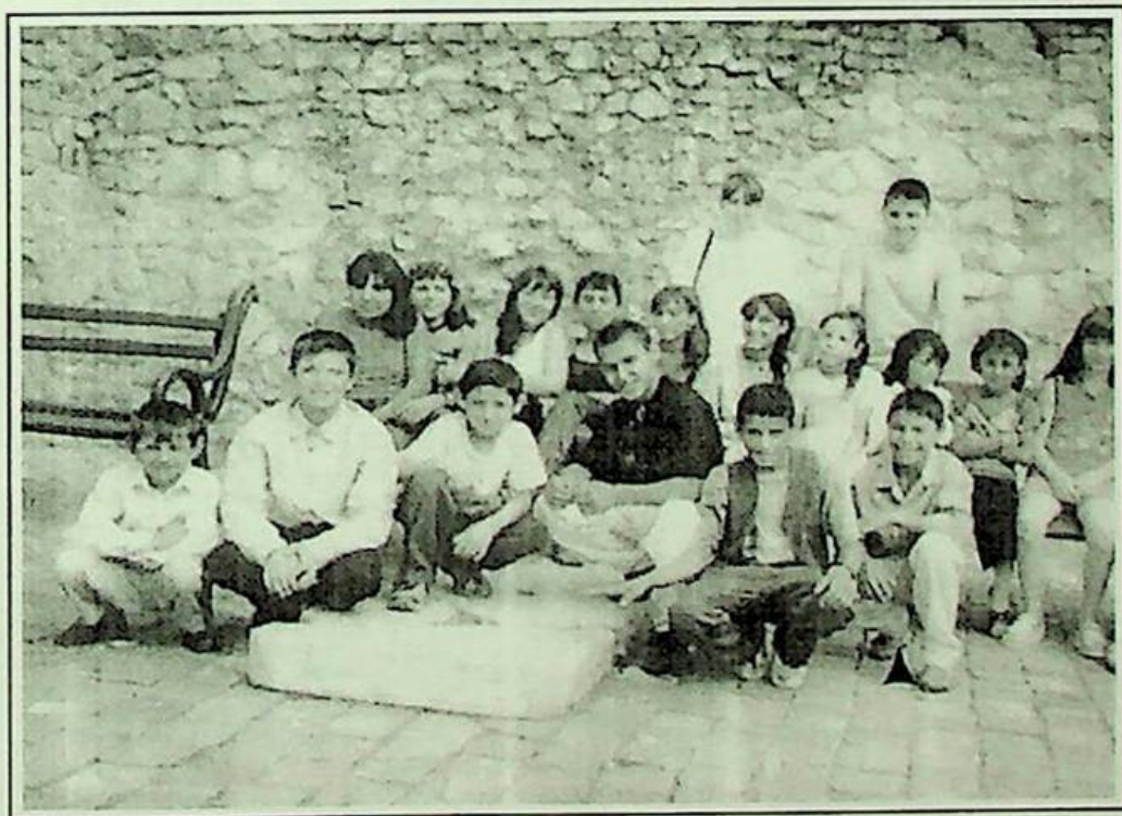
Учні недільної школи с. Кошцovo. 2003 рік.