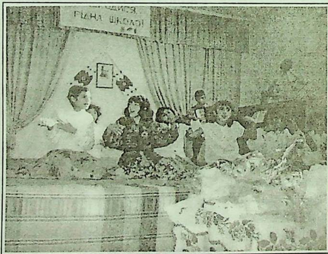
Виступ на святі. 2001 рік.