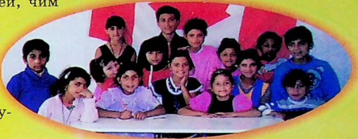
На світлині:вихованці недільної ромської школи по вул. Пірогова в Ужгороді готуються до виступу.

"Орачки" - ансамбль знаній не тільки у Словаччині. З гастролями він побував у Польщі, Чехії, Іспанії, Швейцарії. Всюди виконавців супроводжував успіх, їх тепло приймали слухачі.