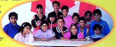
На світлині:вихованці недільної ромської школи по вул. Пірогова в Ужгороді готуються до виступу.

"Орачки" - ансамбль знаний не тільки у Словаччині. З гастролями він побував у Польщі, Чехії, Іспанії, Швейцарії. Всюди виконавців супроводжував успіх, їх тепло приймали слухачі.