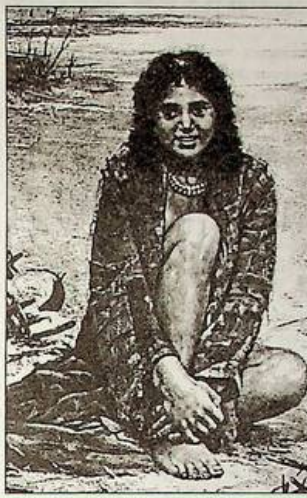
Антоні Козакевич. "Циганська дівчина в халаті". 1909 р., п., о.

Репродукцію цієї картини я вперше побачив понад десять років тому. І зізнаюся - не повірив автору. Нерідко буває, що за ромську тему беруться люди випадкові, із числа тих, хто судить з чутка. От і тут: табірна дівчина в халаті на голому тілі, без широкої спідниці... Де ж це бачено?