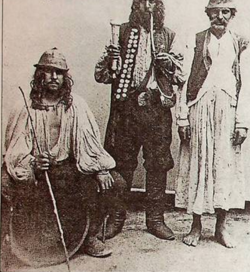
Роми з групи келдерарів. 1865 р. (Ілюстрація з книги Jerzy Ficowski "Gygane w Polsce")

гато спільного з ромською. Допоміг випадковий збіг: Іштван Вайя знав мову ромів (тоді на території Австро-Угорщини, частини колишнього Священної Римської імперії, їх проживало чимало). Ця, здавалося б, рядова подія і послужила початком наукового вивчення історії ромів, бо загаданий номер газети потрапив у руки німецького дослідника Генріха Грельмана. Прочитавши повідомлення, Грельман припустив, що описаний малабарець міг бути сином браміна, мовою яких був санскрит (літературно оброблений різновид давньоіндійської мови індоєвропейської мовної групи, що має тисячолітню історію). І вчений вирішив співставити дві мови. А зробивши це, він побачив різкий збіг циганської і санскритської мов, а з новоіндійських - із мовою хінді. Саме Грельман висунув гіпотезу про індійське походження ромської мови. Його праця на цю тему була видана у Росії вже в 1874 році. Інший німецький учений, один з основоположників наукової етимології Фрідріх Потт, у своїй фундаментальній праці "Цигани в Європі й Азії" (1844 рік), довав, що батьківщиною ромів є Індія, а ромська мова - одна з новоіндійських мов. Що роми активно сприймали елементи мов усіх народів, де вони кочували. Перед Поттом стояло важке завдання: в освітній Європі того часу існувало тверде переконання, начебто ромська мова - це аргі злочинного світу. У це вірили усі, навіть серед академічних кіл.