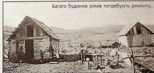
Багато будинків ромів потребують ремонту...

Ті монолози та діалоги, які записані на касету, - переконують у багатстві вульгарної лексики