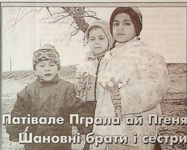
Патівале Пграла ай Пгеня Шановні брати і сестри

8 Априло кодо сі амаро Романо Дівес, анде саво аме саворе сам анде єкг, сар пграла ай пгена. Амаро єкгіне, пграліне дел аменге барі зор, саві тробуй аменге андре амаро джівіпен (трайо). Анде кодо мекг дел о Баро Девел саворе Роменге ілеско пграліне, бахт, састіне ай зор анде бувте, саве керен пекскере фамілії ай кавере манушенге.