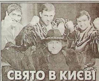
СВЯТО В КИЄВІ