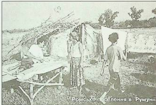
Ромське поселення в Румунії

Узгоронець д-р Імре Кардашинець, який нині проживає у Сполучених Штатах Америки, люб'язно запропонував газеті "Романи Я" статтю відомого американського автора Пітера Годвіна "Роми - аутсайдері", яка мала добрий відгук на далекому континенті. Як колишній журналіст радіо "Свобода", він вважає, що дана стаття зацікавить і ромів України. Пропонуємо читачам продовження публікації з цієї статті.