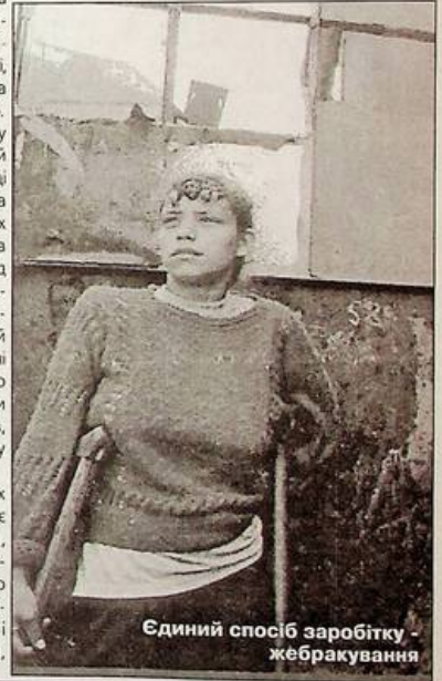
Єдиний спосіб заробітку - жебракування

Пітер Годвін, переклад із англійської Ірини Білявської.