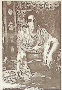
М.О.Віщунка "Зорянка", 1878 р.

ОВЕН - згадайте про людські стосунки, але не забувайте, що відповідальність все-таки лежить на вас. Не бажано міняти місце проживання саме зараз, зважте ще раз на всі обставини. Люди іншої віри або національності - ваші найкращі помічники.