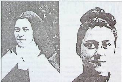
На світлині: Агнес Бояджіу в 1928 році перед від'їздом до Калькутти

Сім'я Бояджіу належала до католицької громади. Маленька Агнес відвідувала з батьками церкву, співала у церковному хорі, була побожною і романтичною.