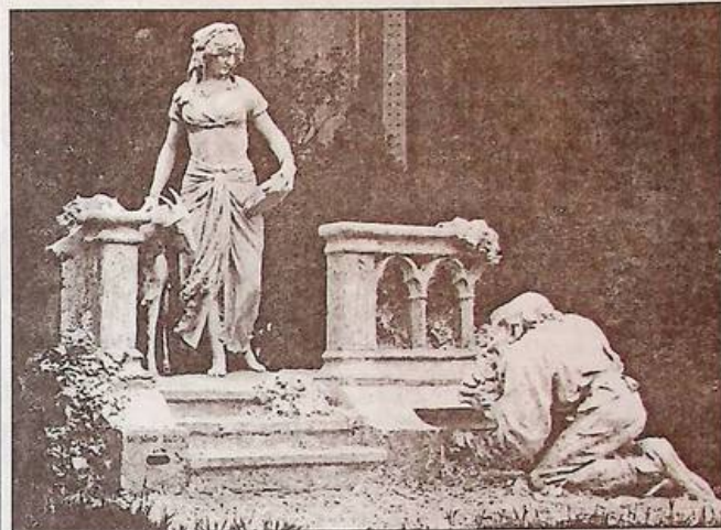
Раймон Сюдр "Есмеральда і Квазімодо". 1913 р.

А успіх до ілюстраторів "Собору Паризької Богоматері" прийшов набагато пізніше. В другій половині ХХ століття.