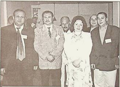
На Закарпатті перебувала Уповноважений Верховної Ради з прав людини Ніна Карпачова. Про зустріч з цією жінкою жіноччю-політиком читайте в наступному номері газети.