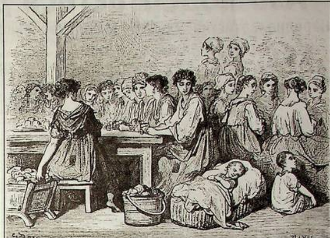
Гюстав Доре. "Набивання сигар". Гравюра. 1874 р.

Коли пишуть про ромів, дуже часто повторюють вислів "кочовий народ". При цьому, звичайно, випускають з уваги, що на Балканах навіть 500 років тому майже половина ромів жила осіло. Всюди існували селища ремісників і навіть хліборобів. Утім, і в Іспанії, після того як король Карл III у 1783 році видав закон про примусову осілість, кочові табори були змушені обзавестися будинками.