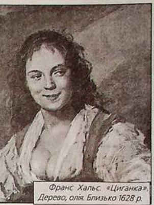
Франс Хальс «Циганка», Дерево, олія. Близько 1628 р.