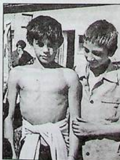
дітей або змушували їх до жебрацтва.

ра України порушила 600 кримінальних справ проти посадових осіб, 500 передано в суд, понад 9 тисяч службових осіб притягнуто до кримінальної відповідальності. До цього додає ще цифру, почуту з уст Наталії Шестакової, начальниці відділу нагляду за дотриманням законності по правах неповнолітніх, на підсумковій прес-конференції для журналістів: порушено дві сотні кримінальних справ проти батьків, котрі ухилялися від своїх обов'язків по утриманню