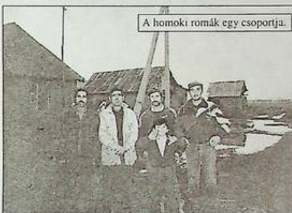
A homoki romák egy csoportja.

A tábort harmadik koldulásból él. Mindig összeszorul a szívem, amikor akár esik akár fúj látom a roma asszonyokat gyerekeikkel koldulni menni. Rávanak kényszerülve, hogy összekoldulják azt a 2-3 hrivnyát, amiből egy kis ételt főznek nagy családjuknak.