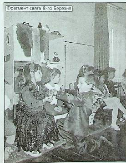
Фрагмент свята 8-го березня

Іграшки, деякий одяг для дітей ми отримали за допомогою спонсорів. Так що, як виявилось, друзів і доброзичливих помічників