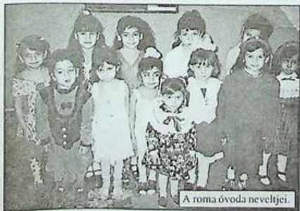
A roma óvoda nevelője.