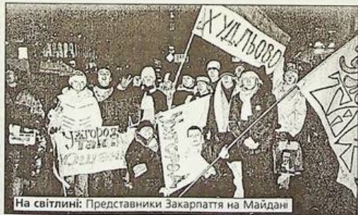
На світліні: Представники Закарпаття на Майдані

У серпні 1991 року місто Ужгород було єдиним містом України, в якому депутати міської ради проголосували проти спроби державного перевороту. Поки секретар ЦК КПУ Івашко роздумував, куди перекинутись, Ужгород висловив своє "ні" гекачепістам.