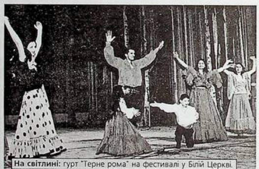
На світлині: гурт "Терне рома" на фестивалі у Білій Церкві.

У м.Біла Церква відбувся фестиваль "Ромської пісні" за підтримки президента всеукраїнської організації "Роми України" Петра Дмитровича Григориченка. В цьому фестивалі взяли участь вісім ромських гуртів з усієї країни. Гурт "Терне рома" Переяслав-Хмельницької обцини "Рома Переяславщини" вперше за коротке існування організації також був учасником цього прекрасного свята. Ми дуже вдячні президенту "Роми України" Петру Дмитровичу Григориченку, а також голові міської ради Григорію Романовичу Сакурі і міському відділу культури за їхню допомогу в організації поїздки на фестиваль.