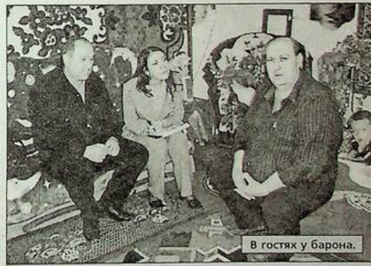
В гостях у барона.