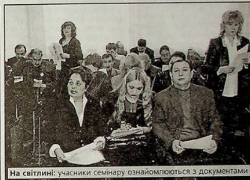
На світліні: учасники семінару ознайомлюються з документами

Пропонуємо нашим читачам основні напрями політичної діяльності ромів у побудові демократичного суспільства, запропоновані ERRC на семінарі-практикумі.