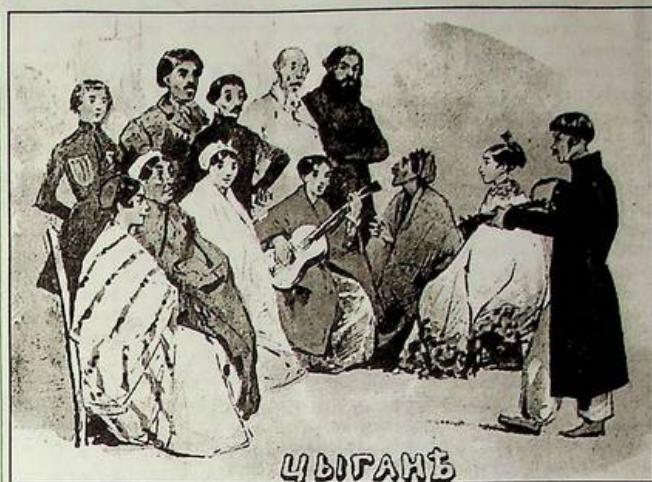
Г.Г. Гагарін. "Цигани". Аquareль. Між 1834 і 1840 р.

У радянський час не любив афішувати творчість "придворної камарильї". На жаль, політика диктувала свої закони. Що б класово далекий художник не малював, його репродукції рідко проривалися до друку. Мабуть, найхарактерніший приклад цього члена товариства передвижників Лемох. Героями цього переконаного демократа від мистецтва були бідні селяни. Пафос його картин був у викритті соціальної нерівності. Але біографія підвела: відомий художник Лемох викладав малювання спадкоємцю престолу. Зараз про нього знають лише фахівці.