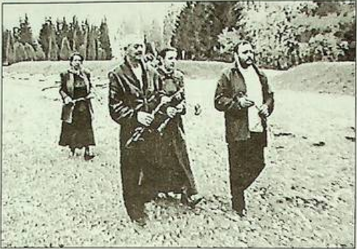
(Закінчення. Поч. на 5 стор.)

На жаль, багато ромів, чи родичі розстріляні в місті Чернігові, не мають уявлення, де це місце знаходиться, тому що на цьому пагорбі немає ніяких розпізнавальних знаків. І тільки завдяки відомцтвам очевидця Герхарда Кузнєцова наша організація довдалася про місце масових розстрілів ромів. Приєднуючись до численних прохань представників ромського народу, чи родичі загинули від рук нацистів у Чернігові, наша організація поставила за мету знайти фінансування, щоб відновити справедливості і компенсувати той біль, що пережили роми в роки війни, - сподіюємося, це стане реальністю.